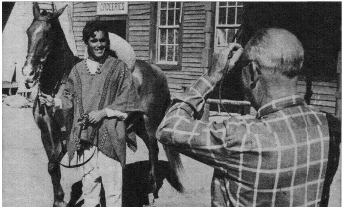
Desde Santa Mónica, Estados Unidos, han venido los padres del actor para verle rodar y para conocer España. Papá Hunter retrata frecuentemente a su hijo