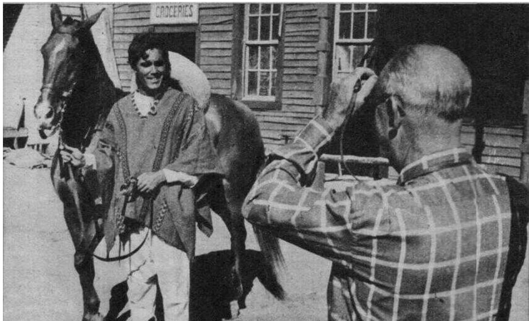
Desde Santa Mónica, Estados Unidos, han venido los padres del actor para verle rodar y para conocer España. Papá Hunter retrata frecuentemente a su hijo