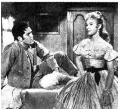
Avec Virginia Mayo dans « Le Shérif » un de ses meilleurs westerns